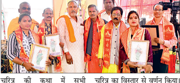
चरित्र का विस्तार से वर्णन किया। महाराज ने कहा कि भरत ने हाथ जोड़ कर महर्षि भारद्वाज से कहा कि