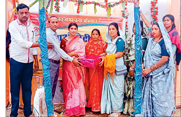
हरिभूमि न्यूज़ ▶▶ गुण्डरदेही